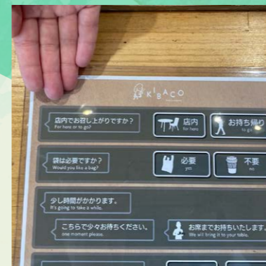
聞こえない人や、外国人とも指差しで会話できるシート