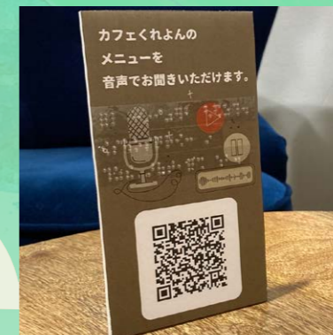
見えない人にも情報を届けられる音声で聞けるメニュー